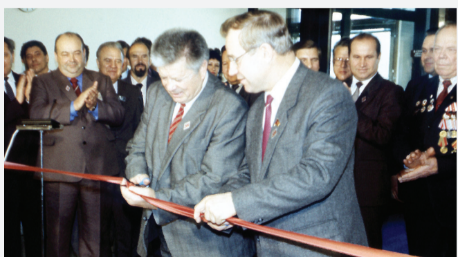
Святослав Николаевич Федоров (слева) на открытии Оренбургского филиала ФГАУ «НМИЦ «МНТК «Микрохирургия глаза».

К наиболее ярким достижениям С. Н. Федорова в развитии офтальмологии относятся: лечение катаракты и использование искусственного хрусталика; освоение хирургии стекловидного тела и сетчатки, хирургии роговицы, рефракционной хирургии; применение эксимерных лазеров.